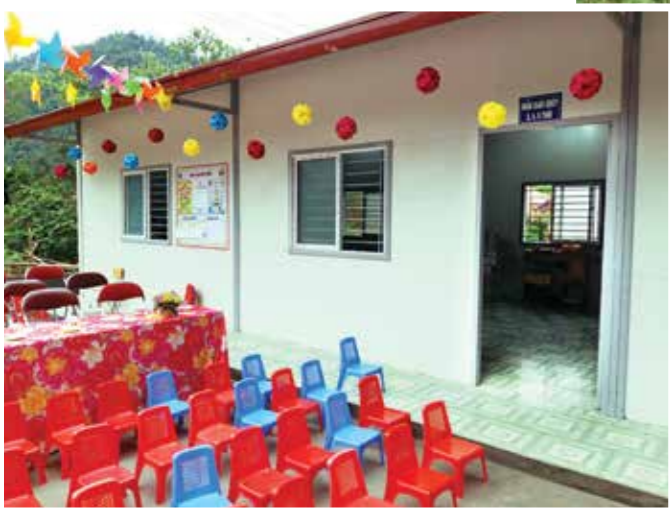
Trường mầm non Tà Lành sau khi hoàn thành.