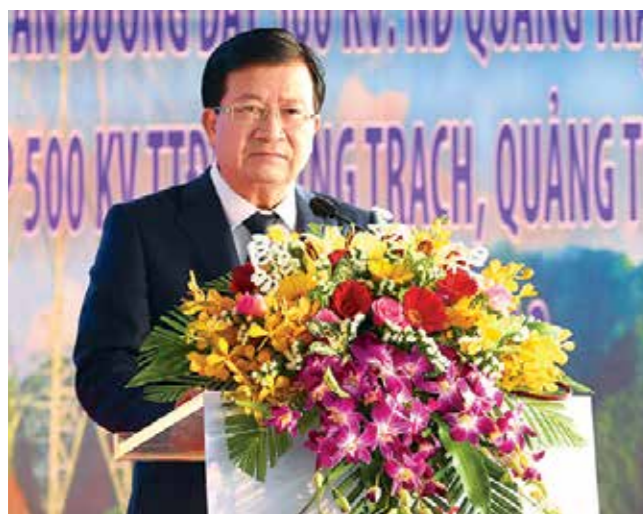
Phó Thủ tướng Chính phủ phát lệnh khởi công.

Phát biểu tại buổi lễ, Phó Thủ tướng Trịnh Đình Dũng khẳng định việc đầu tư thêm các đường dây truyền tải điện 500 kV mạch 3 là hết sức cấp bách, do xu hướng thiếu điện ở phía Nam sẽ gia tăng vào những năm tới, trong khi công tác đầu tư nguồn điện tại khu vực này đang chậm tiến độ, các tuyến đường dây 500 kV hiện hữu đã đầy tải, có thời điểm quá tải.