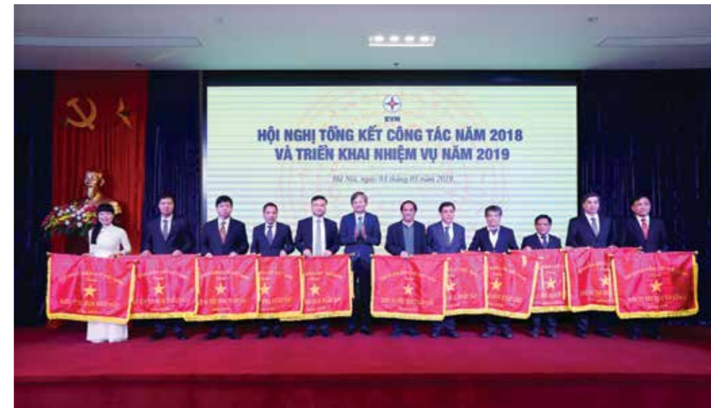
Tổng Giám đốc Tập đoàn tặng cờ thi đua xuất sắc cho các tập thể năm 2018

Trong dịp Tết Nguyên đán Kỷ Hợi, Phó Thủ tướng yêu cầu EVN quan tâm đến đời sống của công nhân, người lao động ngành Điện; chủ động thăm