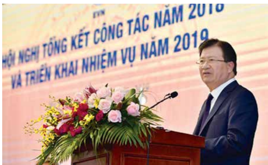
Phó Thủ tướng Chính phủ phát biểu chỉ đạo tại Hội nghị.

Báo cáo EVN tại Hội nghị cho thấy, tuy gặp nhiều khó khăn nhưng EVN đã thực hiện tốt nhiệm vụ điều phối, bảo đảm cung ứng đủ điện cho phát triển kinh tế - xã hội và đời sống của nhân dân.