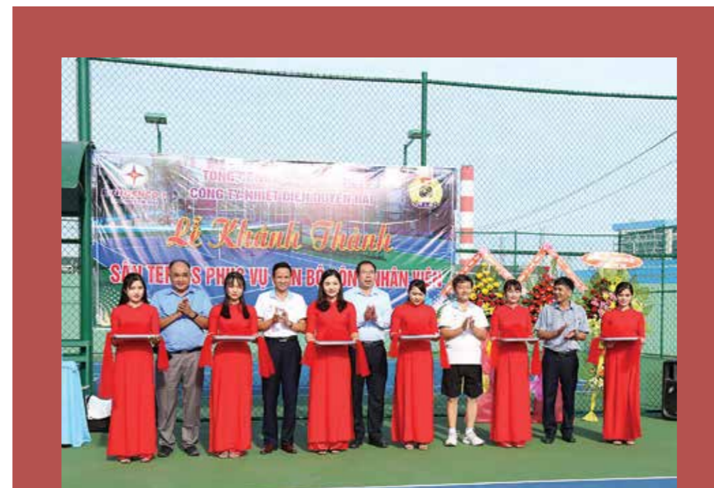
Các đại biểu cùng cắt băng khánh thành sân quần vợt