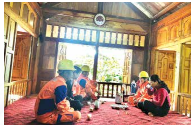
Những người thợ điện gắn bó với bà con vùng cao.