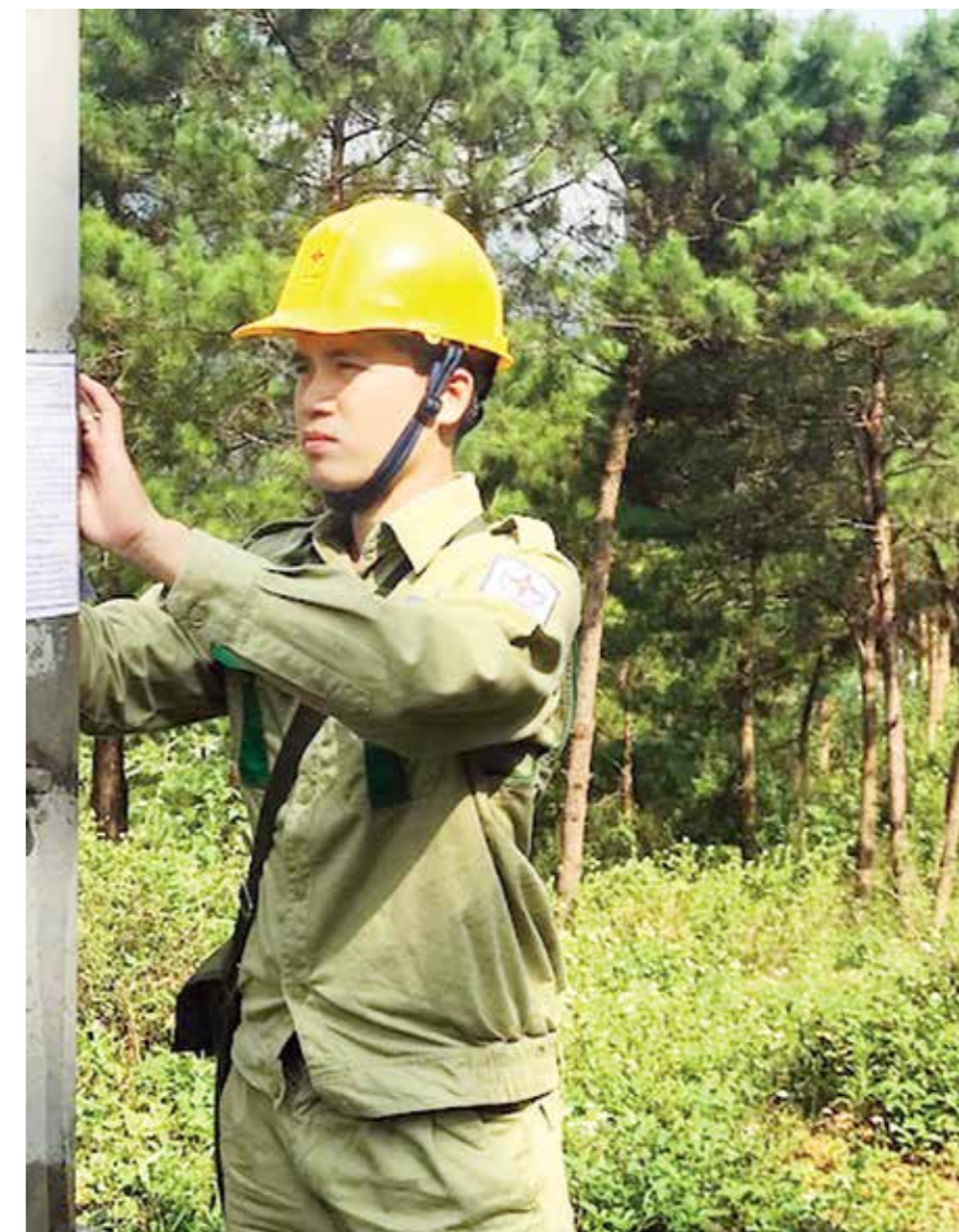
Dán thông báo, số điện thoại đường dây nóng lên cột.