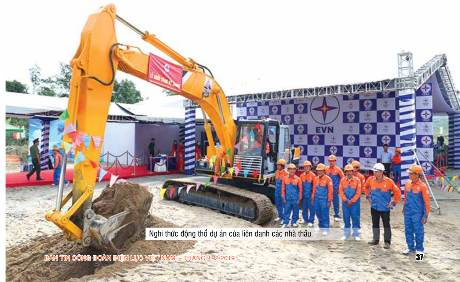
Nghi thức động thổ dự án của liên danh các nhà thầu.

Phó Thủ tướng Trịnh Đình Dũng (đứng giữa) cùng các đại biểu thực hiện nghi thức khởi công các dự án đường dây 500 kV mạch 3.