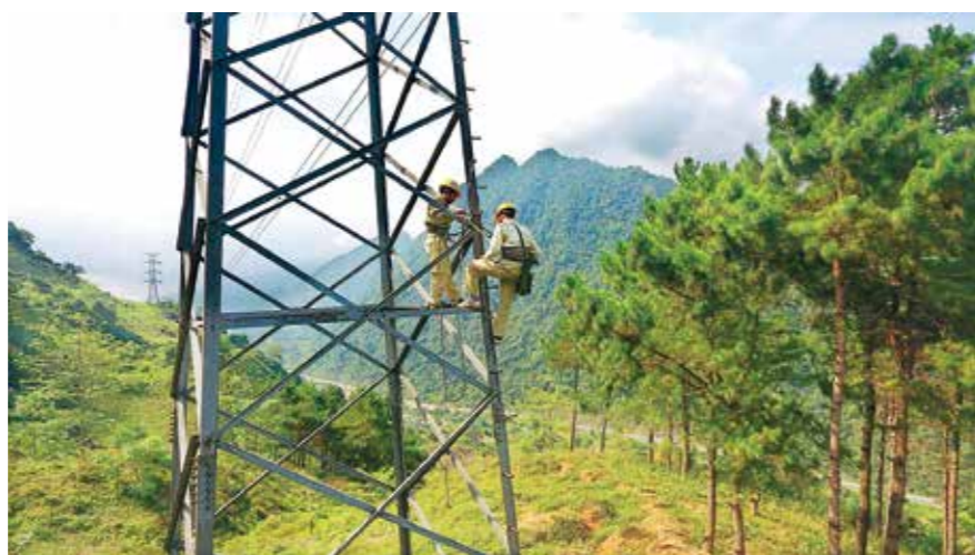
Kiểm tra lưới điện.

Khó khăn về trụ sở làm việc, điều kiện làm việc, lao động đã được cải thiện thì khó khăn về chuyên môn, quản lý, vận hành vẫn luôn hiện hữu và có tính đặc thù so với các Trạm biến áp (TBA) khác trong cả nước.