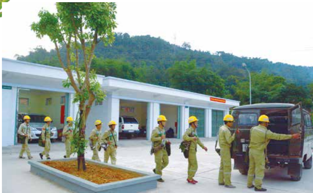
Công nhân chuẩn bị lên tuyến.