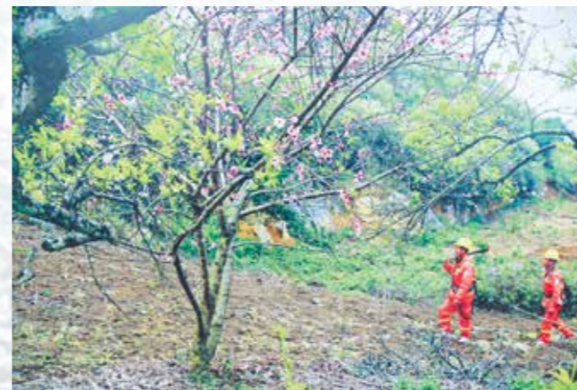
Vùng cao vào Xuân.

gần 14 năm, có 8 lần trực Tết cho biết: Địa bàn huyện Bắc Quang rất rộng, hệ thống lưới điện đi qua địa hình phức tạp, hiểm trở, chỉ cần một tác động nhỏ cũng có thể xảy ra sự cố. Trực tết vào những thời điểm giao thừa là căng thẳng nhất, vì chỉ cần một phút không có điện là ảnh hưởng đến sinh hoạt của khách hàng. Vì vậy, mỗi khi nhận được lịch phân công trực Tết, anh Quyết vừa lo, nhưng cũng rất đỗi tự hào vì được đóng góp một phần đảm bảo dòng điện cho người dân có một cái Tết trọn vẹn. Cũng vì lẽ đó, chuyện ăn tết trên trụ điện, trên đường dây không phải là chuyện xa lạ với những thợ điện cắm bản vùng cao.