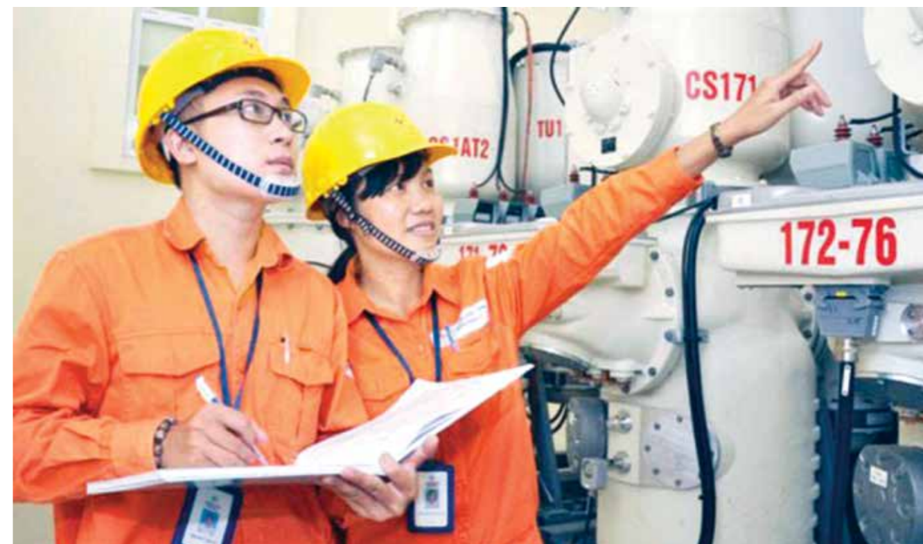
Công nhân QLVH kiểm tra tại trung tâm điều khiển tự động hóa