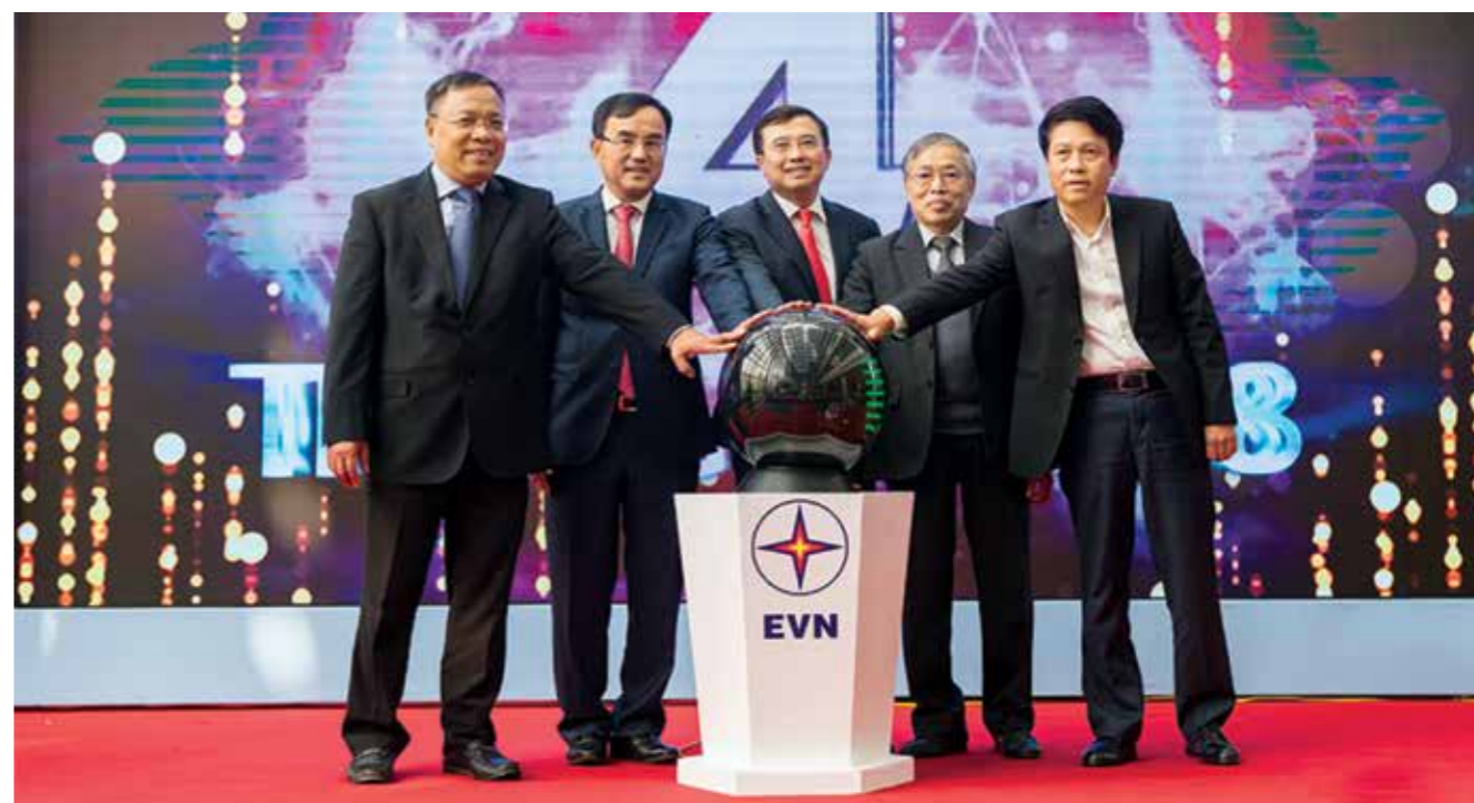
Chủ tịch HĐQT EVN Dương Quang Thành cam kết: “EVN sẽ đáp ứng mọi yêu cầu cung cấp dịch vụ điện hợp pháp của khách hàng, đúng chất lượng công bố, đúng nội dung và thời gian công bố; thực hiện theo “cơ chế một cửa” từ khi tiếp nhận đến khi kết thúc dịch vụ, khách hàng chỉ cần giao dịch trực tuyến trên website là được đáp ứng dịch vụ; đơn giản, thuận tiện, công khai, minh bạch, để kiểm tra, dễ giám sát”. Trong ảnh: Các đại biểu thực hiện nghi thức kích hoạt dịch vụ điện trực tuyến cấp độ 4.