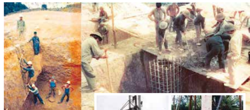
Đào đúc móng ở Phú Lộc, Thừa Thiên Huế (năm 1993).

Ở đây, rừng già mênh mông, từ quốc lộ 14 vào vị trí đúc móng dài tới 30 km, mà không có cách nào vào được. Chính phủ phải huy động Quân khu 4,5,7, Binh đoàn 15, 12, Quân đoàn 3... đi dọn hành lang tuyến để thi công. Việc tập kết sỏi đá, xi măng vận chuyển lên đỉnh núi vô cùng gian nan, vất vả. Có vị trí không thể dùng máy móc đưa vật tư lên được, anh em công nhân và cả người dân địa phương phải gửi từng kg