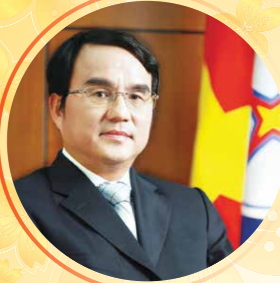
Đồng chí DƯƠNG QUANG THÀNH - Bí thư Đảng ủy Chủ tịch HĐQT Tập đoàn Điện lực Việt Nam:

“Trong năm 2019, tôi mong muốn toàn thể CBCNV, người lao động của ngành Điện tin tưởng vào sự lãnh đạo, điều hành của Lãnh đạo Tập đoàn Điện lực Việt Nam và gắn bó, đoàn kết, có tinh thần trách nhiệm vượt qua các khó khăn, thách thức, đạt được những chỉ tiêu mà Tập đoàn đã đặt ra. Đồng thời góp phần sản xuất, kinh doanh có hiệu quả, có lợi nhuận và đảm bảo đời sống cho CBCNV và người lao động.