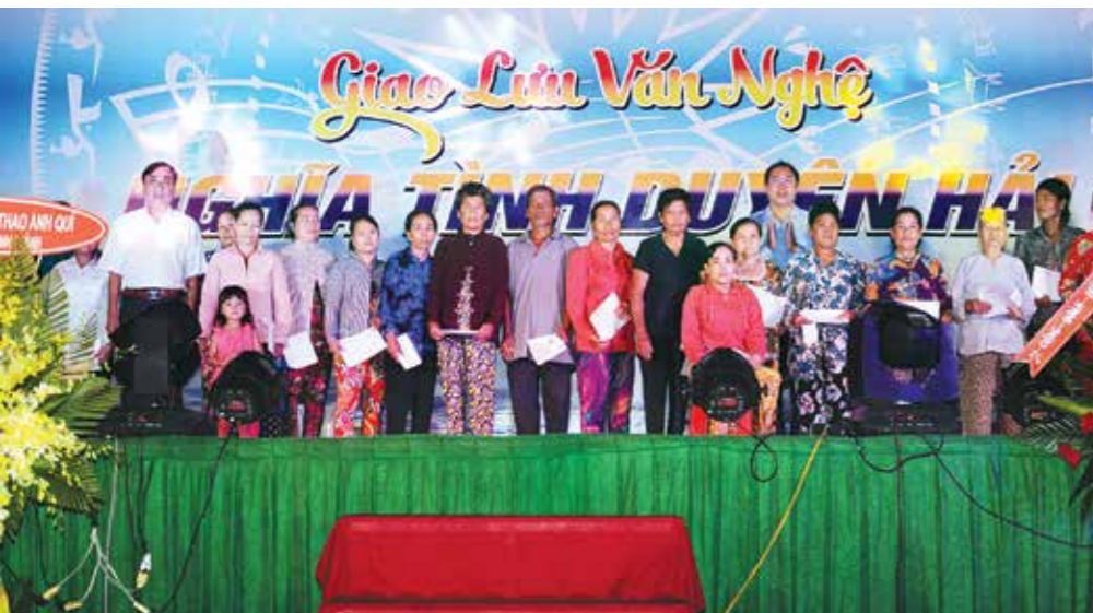
Lãnh đạo Thị ủy Duyên Hải và Lãnh đạo Công đoàn Điện lực Việt Nam trao quà cho các gia đình khó khăn.