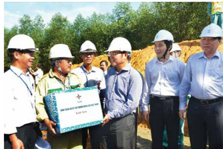
Chủ tịch HĐTV EVN Dương Quang Thành tặng quà chúc Tết người lao động trên công trường.