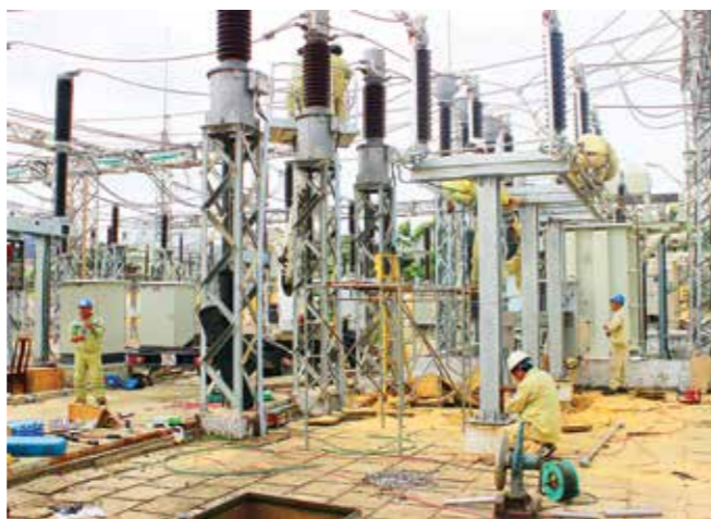
NPTS sửa chữa thay thế máy cắt và dao cách ly 220 kV.

Đó là hình ảnh người thợ điện cao thế miền Trung với những đôi tay chai sần vì bê tông, sắt thép. Là vết chân chim mưa nắng còn lại trên làn da. Là giọt mồ hôi cay xèo âm thầm nơi khóe mắt. Là những đêm mưa, rét chung chăn nơi lán trại trên công trường... Đó là sự cống hiến thầm lặng của người thợ điện cao thế miền Trung cho dòng năng lượng quê hương