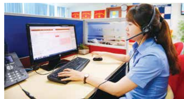
Từ cuối năm 2015, EVN đã thành lập và đưa vào hoạt động 5 Trung tâm Chăm sóc khách hàng (CSKH) trên phạm vi cả nước. Nhân viên Trung tâm CSKH Tổng công ty Điện lực TP.Hồ Chí Minh trả lời những thắc mắc của khách hàng.