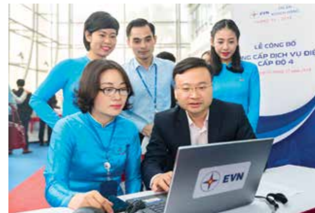
Tính đến hiện nay, Tập đoàn Điện lực Việt Nam đang cung cấp điện trực tiếp tới trên 27,6 triệu quý khách hàng trên cả nước; 100 % số xã và 11/12 huyện đảo đã được EVN cung cấp điện trực tiếp qua điện lưới Quốc gia hoặc các nguồn năng lượng tái tạo tại chỗ như điện mặt trời, điện gió. Trong ảnh: Khách hàng trải nghiệm những dịch vụ cung cấp điện trực tuyến.