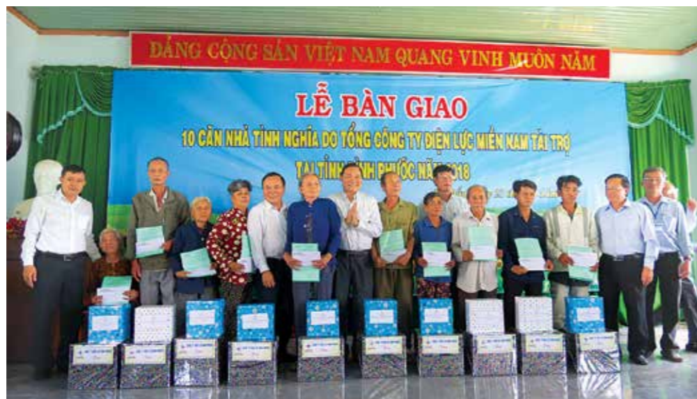
Tặng nhà tình nghĩa, tình thương cho bà con ở Bình Phước.

“Mua đất được rồi, nhưng xây nhà thì khó quá”, anh Phương bộc bạch và xúc động cho biết, “nếu không có