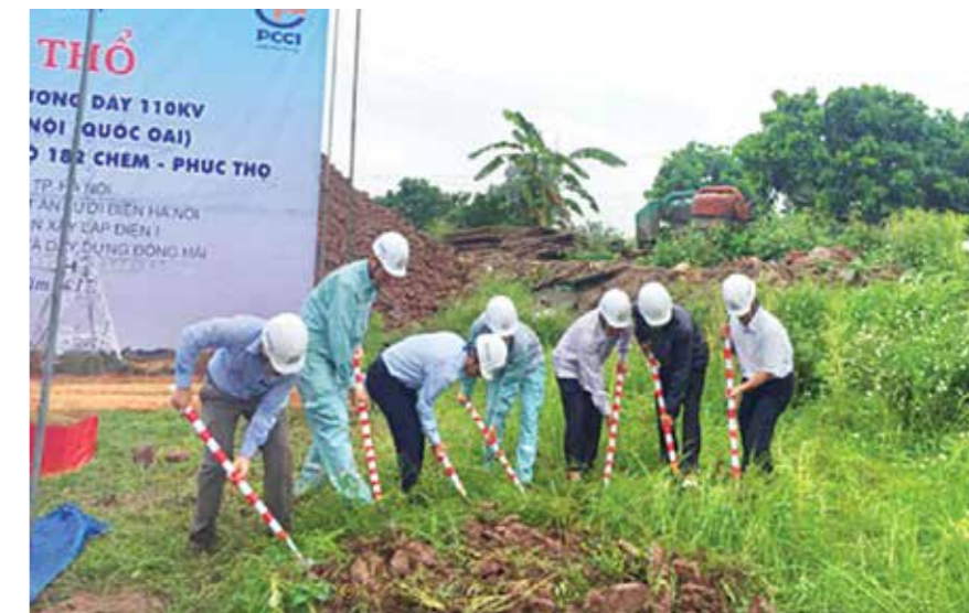
Với những người làm công tác dân vận đến bù GPMB, niềm vui chỉ thực sự có được khi giải phóng được mặt bằng của các dự án điện.

Bên cạnh những dự án có thời gian GPMB kéo dài 3-5 năm, cũng có những