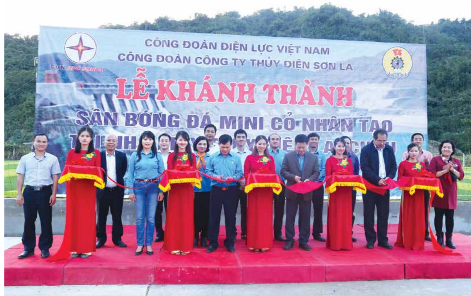
Cắt băng khánh thành sân bóng đá do Công đoàn ĐLVN tài trợ kinh phí.