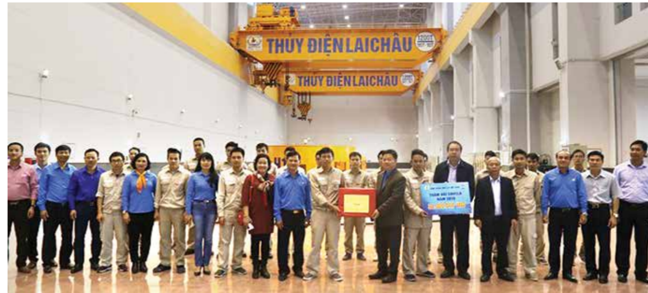
Chủ tịch Công đoàn ĐLVN và đoàn công tác tặng quà và thăm hỏi Tết CNLĐ Công ty Thủy điện Sơn La