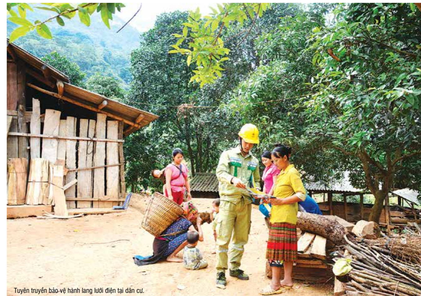
Tuyên truyền bảo vệ hành lang lưới điện tại dân cư.

Chia tay những người dân ở Hà Sơn, những người thợ Truyền tải điện Hà Giang, mặc dù còn nhiều khó khăn, nhưng chúng tôi đã thấy nụ cười ấm áp nghĩa tình của người dân địa phương khi nói về những người “giữ điện” nơi núi rừng biên cương. ■