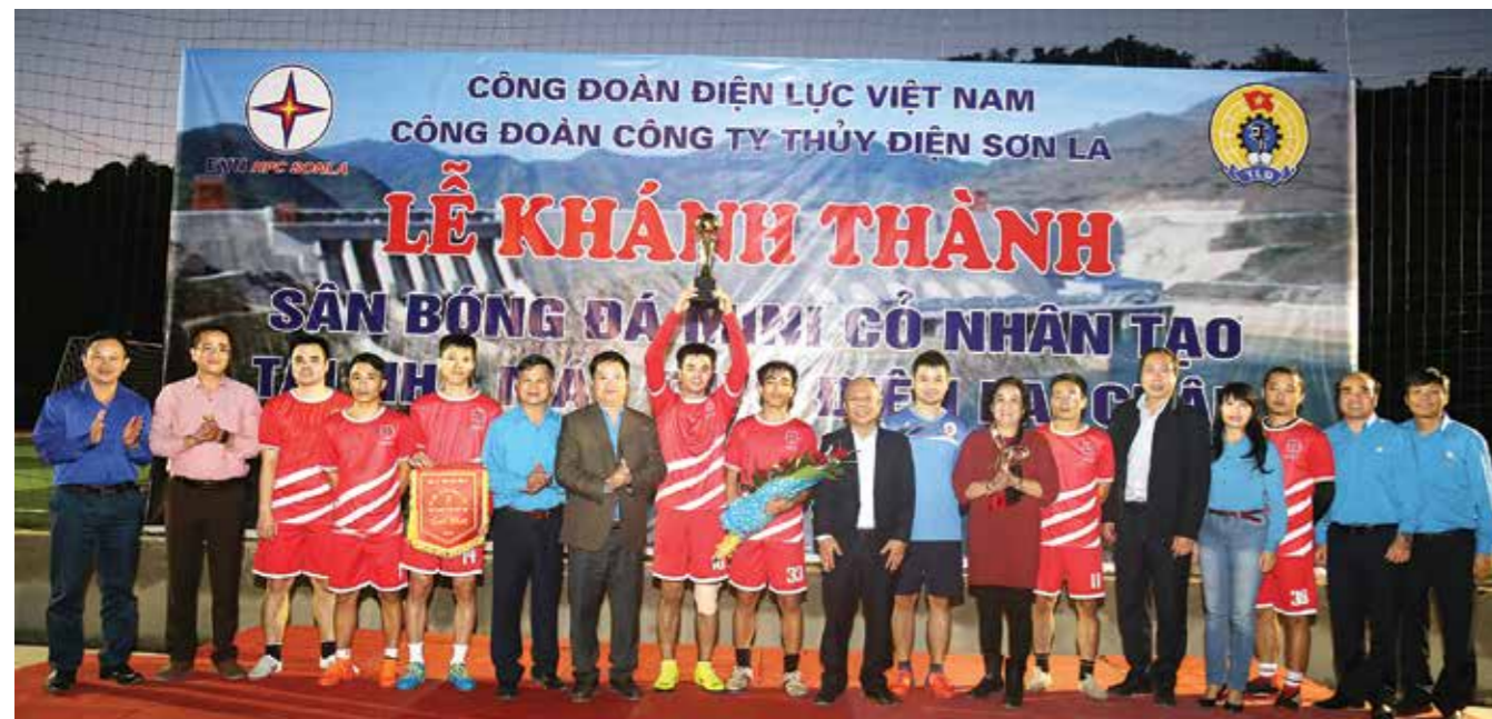
Chủ tịch CĐ ĐLVN trao tặng Cúp vàng cho đội vô địch ngay tại Lễ khánh thành sân bóng đá có nhân tạo.

chào mừng ngày Truyền thống ngành Điện lực Việt Nam, những người lao động tập trung đông đủ tại sân bóng đá mới được hoàn thiện để dự lễ khánh thành. Mặt sân bóng là cỏ nhân tạo với tiêu chuẩn cấp FIFA được đầu tư xây dựng trên nền đất mới cách khu tập thể Nhà máy Thủy điện Lai Châu vài trăm mét tại trung tâm thị trấn Nậm Nhùn, huyện Nậm Nhùn. Toàn bộ sân bóng và hệ thống đèn chiếu sáng, hàng rào, mặt cỏ được Công đoàn ĐLVN hỗ trợ gần 700 triệu đồng. Công trình được gắn biển cấp Công đoàn ĐLVN nhân kỷ niệm 64 năm ngày Truyền thống ngành Điện lực Việt Nam thực sự là món quà ý nghĩa đối với những người lao động đang ngày đêm làm việc nơi núi rừng Tây Bắc.