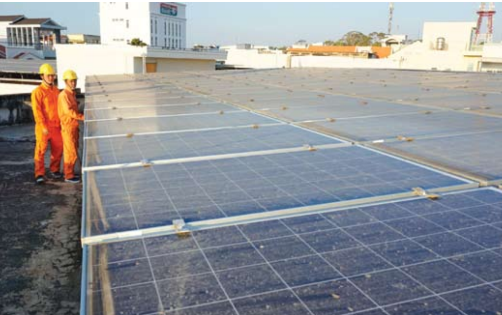
Công nhân Điện lực TP. Trà Vinh kiểm tra hệ thống NLMT tại Văn phòng Công ty.