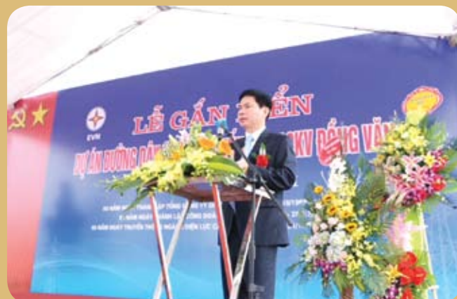
Ông Trương Quốc Huy - Phó Chủ tịch UBND tỉnh Hà Nam.