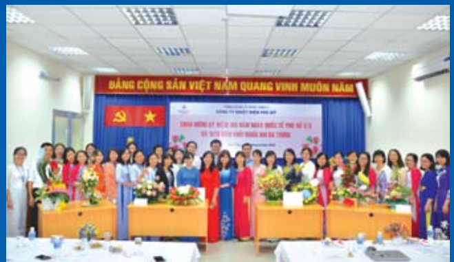
Tổ chức thi cắm hoa tại Công ty Nhiệt điện Phú Mỹ - Genco3.