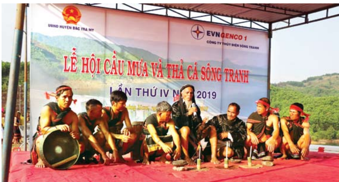
Người dân tộc Cor, huyện Bắc Trà My làm lễ cầu mưa, cầu mùa màng bội thu.