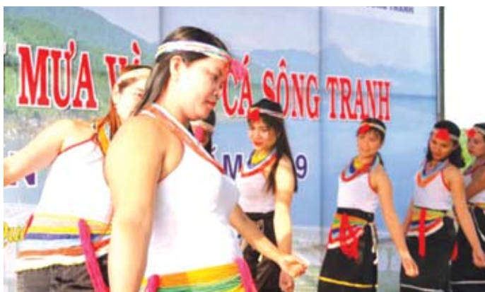
Những vũ điệu được các cô gái thể hiện trong lễ cầu mưa.