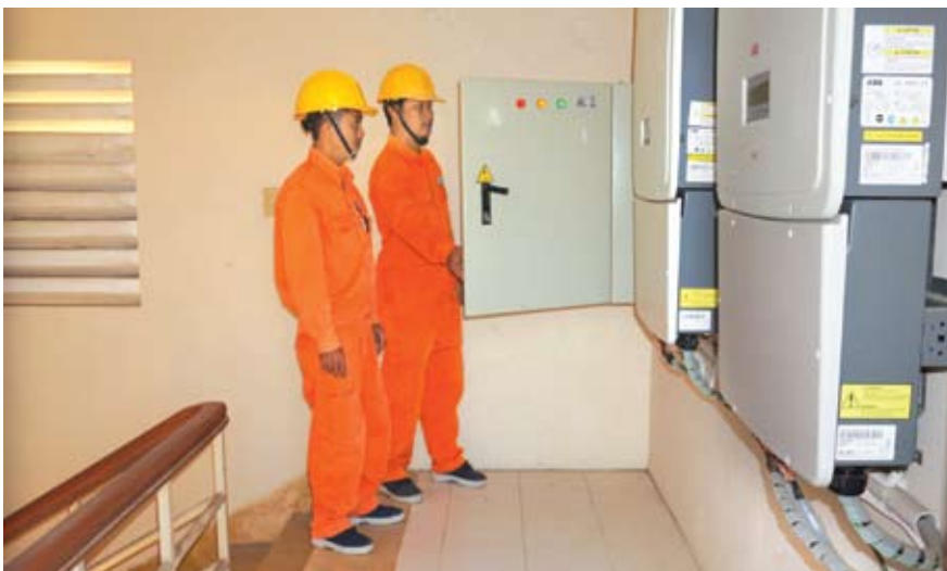
Công nhân Điện lực TP. Trà Vinh kiểm tra, vận hành hệ thống tủ điện hệ thống NLMT tại Văn phòng Công ty.

N ăng lượng mặt trời - nguồn năng lượng quý giá vô tận của thiên nhiên mang lại nhiều lợi ích cho con người.