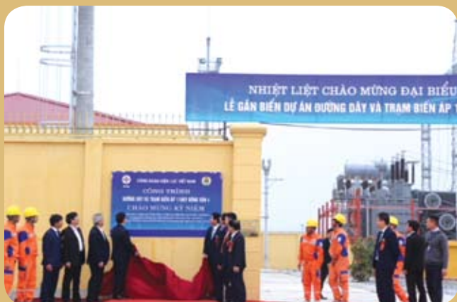
Lễ gắn biển dự án đường dây và trạm biến áp (TBA) 110 KV Đồng Văn 4.