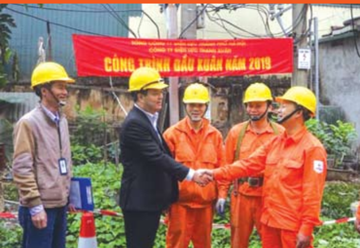
Lãnh đạo Chuyên môn và Công đoàn EVNHANOI động viên và tặng quà CBCNV Điện lực Thanh Xuân.

C ông trình thi công đầu xuân được các đơn vị triển khai thực hiện như: Cải tạo, nâng cấp đường trục cao, hạ thế; đại tu thay thế các máy cắt (MC) 22kV, bổ sung Máy biến áp (MBA) tại Trạm 110kV; xây dựng mới các Trạm biến áp công cộng, thí nghiệm định kỳ các thiết bị... Các công trình đều được Công đoàn đơn vị phối hợp với chuyên môn triển khai thực hiện từ công tác chuẩn bị vật tư, nhân lực và đảm bảo thi công an toàn, đúng yêu cầu kỹ thuật và tiến độ đề ra. Công đoàn cũng đã phối hợp cùng chuyên môn đồng cấp tổ chức thăm hỏi, tặng quà các đơn vị thi công công trình đầu Xuân 2019.