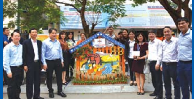
EVN Hà Nội tổ chức trao giải cho đội đoạt giải Nhất Cuộc thi "Gửi gắm yêu thương".