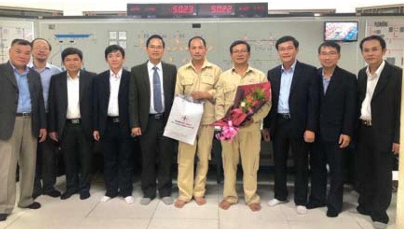
Lãnh đạo Chuyên môn và Công đoàn công ty trao quà cho CBCNV tham gia trực vận hành và sửa chữa thiết bị Tổ máy H3

Đ ợt sửa chữa lần này, ngoài công tác tiêu tu định kỳ, tổ máy H3 Ialy phải thay thế 10 thanh dẫn lớp ngoài máy phát bị hư hỏng, xử lý 10/24 cực từ máy phát bị suy giảm cách điện, thay thế nâng cấp hệ thống điều tốc mới, thay thế toàn bộ các bộ làm mát ổ đỡ, ổ hướng máy phát và nhiều công việc phát sinh trong suốt quá trình sửa chữa tổ máy.