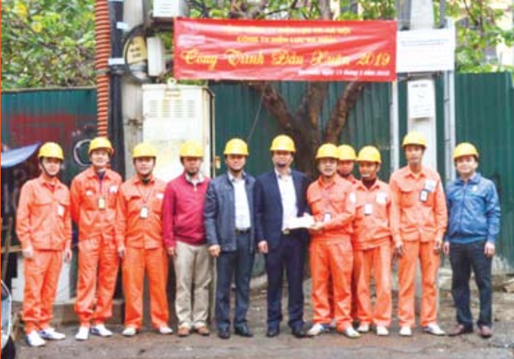
Lãnh đạo Chuyên môn và Công đoàn EVNHANOI động viên và tặng quà CBCNV Điện lực Ba Đình.