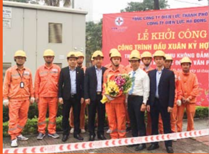
Lãnh đạo Chuyên môn và Công đoàn EVNHANOI tặng hoa và quà CBCNV Điện lực Hà Đông.