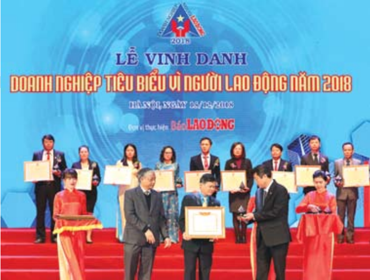
Chủ tịch Công đoàn Công ty Thủy điện Sơn La (đứng giữa, hàng trước) nhận Bằng khen "Doanh nghiệp tiêu biểu vì người lao động năm 2018"