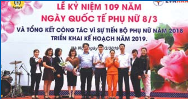
EVN Hà Nội tổ chức tổng kết công tác bình đẳng giới vì sự tiến bộ phụ nữ năm 2018 và kết hợp với tổ chức cuộc thi mô hình "Gửi gắm yêu thương".