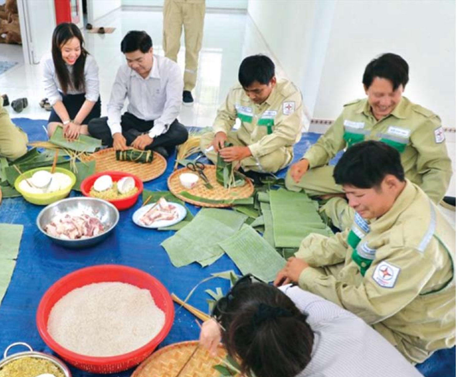
Lãnh đạo PTC4 và CNLĐ Đội truyền tải điện Bù Đăng gói bánh tét vào ngày “Tết sum vầy” dịp Tết Mậu Tuất 2018.