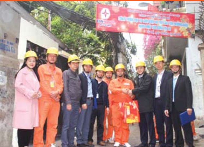
Lãnh đạo Chuyên môn và Công đoàn EVNHANOI động viên và tặng quà CBCNV Điện lực Tây Hồ.