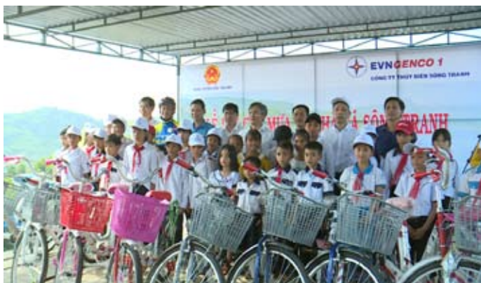
Lãnh đạo Tổng công ty Phát điện 1, Lãnh đạo địa phương và các cháu được tặng quà.