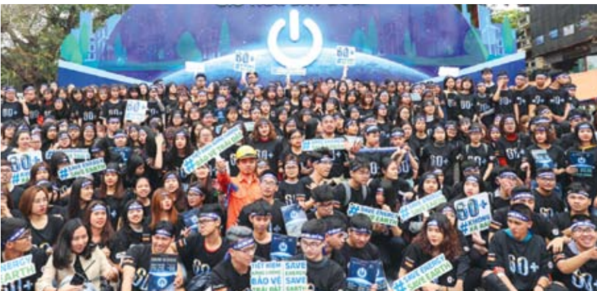
Giờ trái đất là sáng kiến của Quỹ Quốc tế bảo vệ thiên nhiên (WWF), nhằm nâng cao nhận thức cộng đồng về biến đổi khí hậu và tiết kiệm năng lượng. Việt Nam hưởng ứng Chiến dịch Giờ trái đất từ năm 2009 và đến nay đã tạo sức lan tỏa mạnh mẽ, thay đổi tích cực tới cộng đồng xã hội, người dân về ý thức tiết kiệm năng lượng, bảo vệ môi trường.