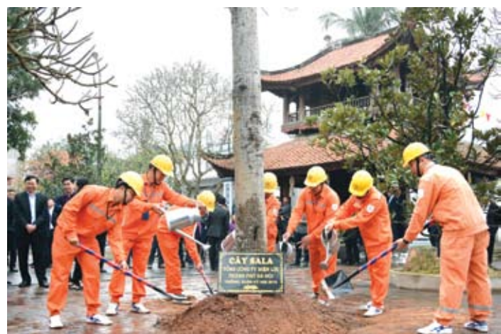
CBCNV Tổng công ty Điện lực TP. Hà Nội tham gia Tết trồng cây

Trồng cây đầu xuân đã trở thành một truyền thống, một nét văn hóa của EVNHANOI mỗi dịp Tết đến Xuân về. Qua đó, góp phần tạo cảnh quan Xanh - Sạch - Đẹp, chống biến đổi khí hậu và bảo vệ môi trường sống.