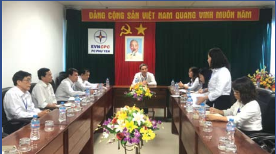
Trưởng Ban Nữ công, Phó Giám đốc Điện lực Tuy Hòa báo cáo chương trình nữ công với nhiều hoạt động đổi mới

Tại buổi làm việc, Ban Nữ công báo cáo tình hình hoạt động thời gian qua, chương trình hoạt động năm 2019 với nhiều đổi mới, bám sát vào chương trình của Công đoàn Công ty. Điểm nổi bật, nhân dịp ngày 8/3, “Hội thi nâng cao kỹ năng hoạt động của cán bộ chuyên môn và công đoàn cấp tổ, đội” được tổ chức tại Điện lực Đông Hòa. Bên cạnh đó, Ban Nữ công tổ chức chương trình từ thiện hỗ trợ 200 suất cơm, 100 suất cháo và 130 ổ bánh mì cho bệnh nhân ở Bệnh viện Sản nhi Phú Yên. Đặc biệt, đồng