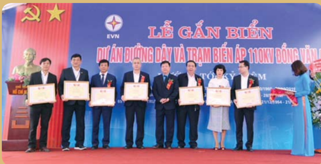
Tặng thưởng các cá nhân và tập thể có thành tích trong năm 2018 và trong quá trình triển khai dự án.