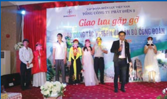
Giao lưu văn nghệ tại Tổng công ty Phát điện 3