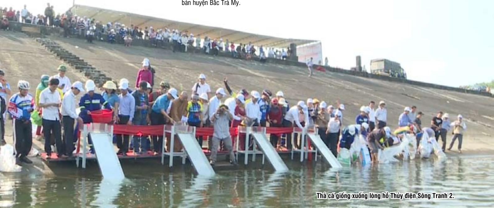
Thả cá giống xuống lòng hồ Thủy điện Sông Tranh 2.