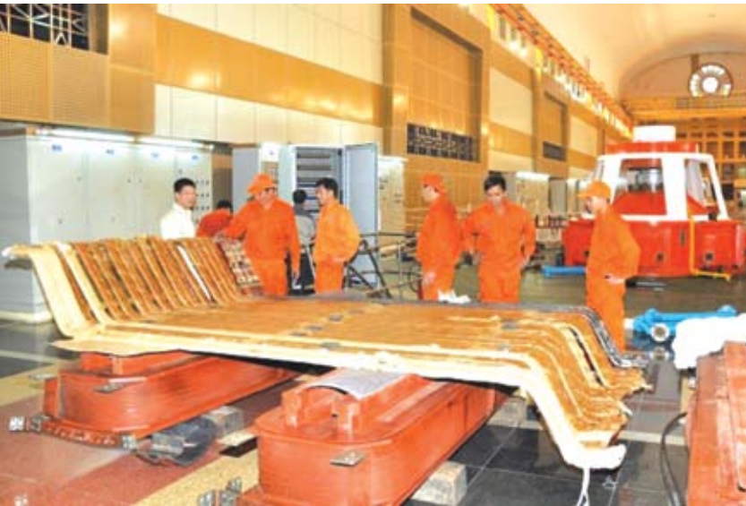
Các kỹ sư, công nhân Công ty Thủy điện Ialy chuẩn bị thay thế thanh dẫn máy phát