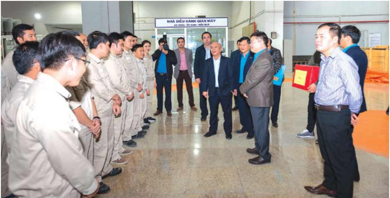
Đoàn công tác CĐ ĐLVN tặng quà những người công nhân trực vận hành sản xuất Nhà máy Thủy điện Lai Châu.