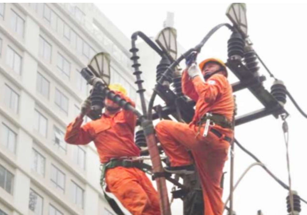
Hình ảnh CNLD EVNHANOI thi công công trình đầu Xuân

Trong không khí vui tươi của những ngày đầu Xuân mới Kỷ Hợi 2019, thi đua lập thành tích mừng Đảng - mừng Xuân, từ ngày 11/02 đến ngày 15/02, các đơn vị trực thuộc Tổng công ty Điện lực TP. Hà Nội (EVNHANOI) đã ra quân triển khai thi công 37 công trình đầu Xuân, nhằm tạo đà phần đầu hoàn thành xuất sắc kế hoạch sản xuất kinh doanh ngay từ những ngày đầu năm 2019.