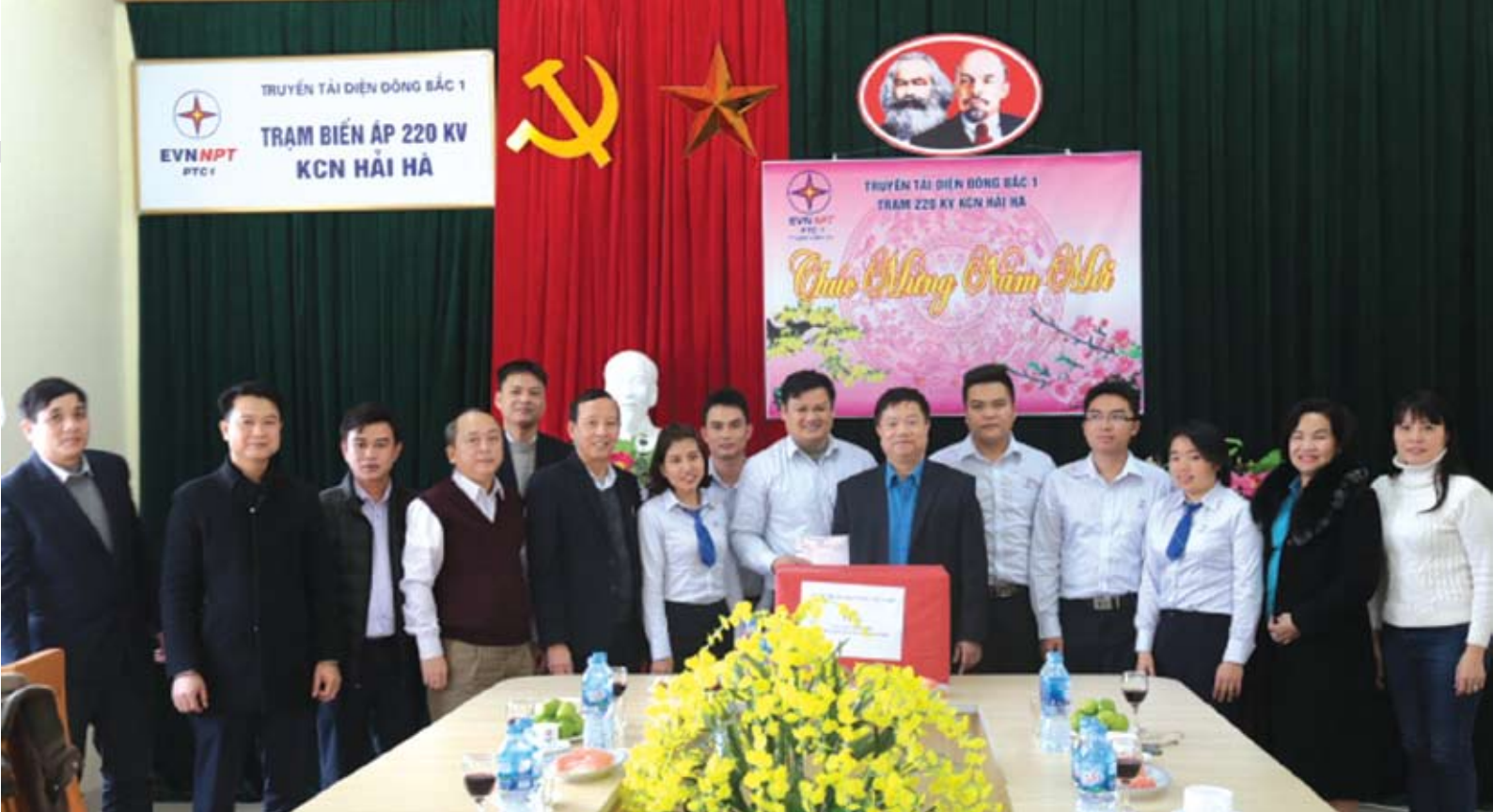
Chủ tịch Công đoàn Điện lực VN và đoàn công tác thăm hỏi tặng quà Công nhân vận hành Trạm 220 kV KCN Hải Hà (Quảng Ninh), Truyền tải điện Đông Bắc 1 (Công ty Truyền tải điện 1).